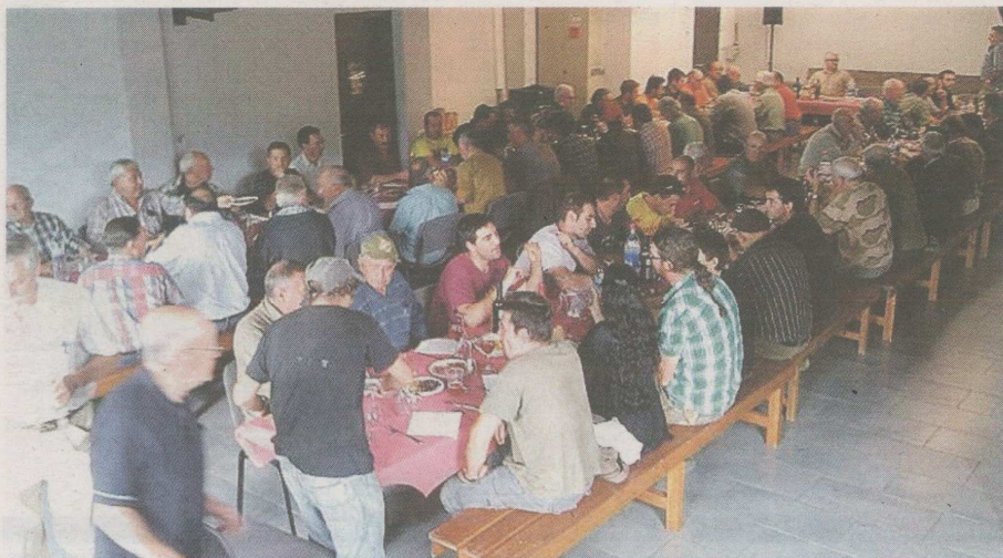
La trobada dels caçadors de les valls de Ribes i de Camprodon que es va celebrar el passat mes d'octubre a Pardines

L'han batejada amb el nom de la collada Verda perquè la via els ha ajudat a agermanar-se