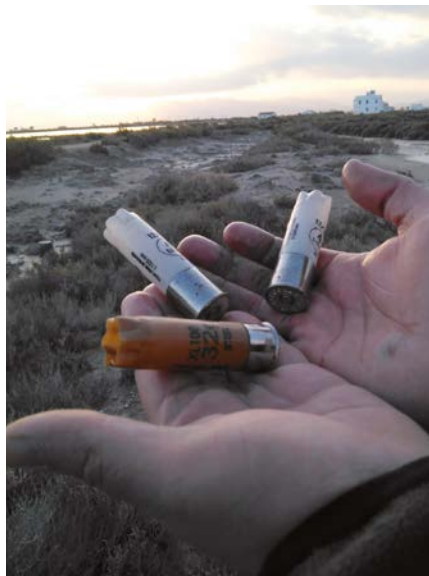
El 2017 es van reciclar, gràcies a aquest projecte, més de 30 tones de baines.