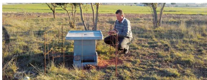
Col·locació d'abeuradors cedits per la Territorial de Barcelona a Sant Fruitós de Bages.

Per tal d'aportar el nostre petit granet de sorra a pal·liar el problema i mostrar una vegada més el nostre ferm compromís i suport amb les societats integrades a la Representació Territorial de la FCC a Barcelona, hem col·laborat amb les societats afectades per aquests incendis cedint diferents abeuradors de formigó per a les perdus, així com plaques de senyalització per als vedats de 1r i 2n ordre. Així mateix, des de la Territorial es va sol·licitar una