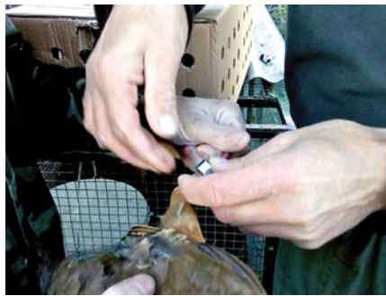
Marcatge de les perdius, amb anella de plàstic, per poder observar la seva evolució després de la solta.