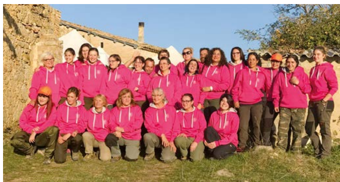
La Pobla de Lillet va acollir la primera de les trobades.

Des de la Representació Territorial de la FCC a Barcelona estem realitzant un important esforç de promoció i potenciació per incorporar les dones a l'activitat cinegètica, quelcom que creiem bàsic per al futur de la nostra activitat. En aquest sentit, hem dut a terme diferents activitats per aconseguir-ho, com és la convocatòria, en el decurs de la passada temporada, de tres trobades de caça adreçades a dones caçadores federades de la província.