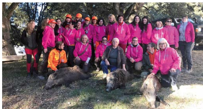
El bon ambient i la companyonia la tònica de totes les trobades.

El colofó d'aquestes tres trobades es va posar el 26 de novembre amb una cacera organitzada per la Societat de Caçadors Pi de Centelles, Sant Martí de Centelles i Hostalets de Balenyà, conjuntament amb la territorial. Novament el bon ambient, la companyonia i la bona valoració per part de les nombroses participants va ser la constant, les quals van destacar la importància d'aquestes activitats com a motivació per a la incorporació de més dones al món de la caça i per donar visibilitat a la figura de la dona en aquest àmbit.