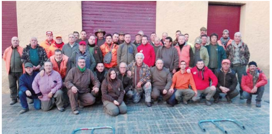
La colla es va formar al 2008 i compta amb 60 integrants.

Entre els principals objectius d'aquest grup de caçadors, a més de la pràctica de l'activitat cinegètica, destaca l'esforç que estan duent a terme per fomentar la caça major entre joves caçadors i caçadores, la formació continuada en aspectes vinculats amb la caça de tots els seus components, així com la col·laboració amb els pagesos de la zona per ajudar-los a evitar els danys provocats als seus conreus per la sobrepoblació del porc senglar. En aquest sentit, cal