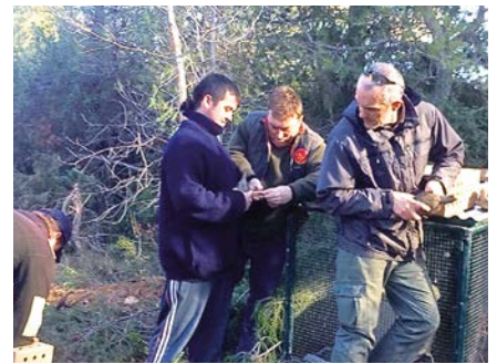
Marcatge de les perdius i solta dins les gàbies d'aclimatament.

A finals de l'any 2017 es va posar en marxa de manera efectiva aquest projecte de reintroducció de la perdiu que compta amb la col·laboració de la Territorial de les Terres de l'Ebre, així com de les quatre societats participants, una per comarca. Les societats participants en aquesta iniciativa van estar escollides mitjançant un sorteig dut a terme en l'Assemblea General del 2017 entre les societats que es van inscriure per participar en aquest projecte de reintroducció de les perdius en les seves àrees privades de caça (APC). Finalment, les escollides van ser la Societat de Caçadors Sant Antoni del Perelló – Baix Ebre–, la Societat de Caçadors Verge de Pallerols de la Sènia –Montsià–, la Societat de Caçadors Sant Jaume i Sant Miquel de la Torre de l'Espanyol i Vinebre –Ribera d'Ebre– i la Societat de Caçadors La Perdiguera de Bot –Terra Alta–.