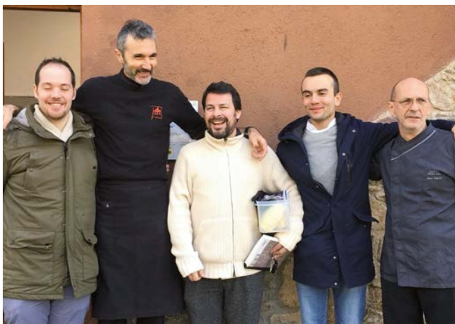
Cuiners participants a les jornades tècniques i pràctiques sobre la carn de caça.

Els passats 14 i 15 de gener Sort va acollir, amb un gran èxit organitzatiu de participació, la celebració de la primera Gran Festa dels Banuts, una trobada gastronòmica i tècnica sobre la carn de caça major, amb els cérvols, les daines i els cabirols com a principals protagonistes. Aquesta iniciativa, promoguda pel Consorci Leader Pirineus, l'Associació Gastronòmica La Xicoia i l'Ajuntament de Sort, neix amb la voluntat d'esdevenir una trobada anual dels amants de la cuina de caça i la promoció de les activitats culturals pirinenques.