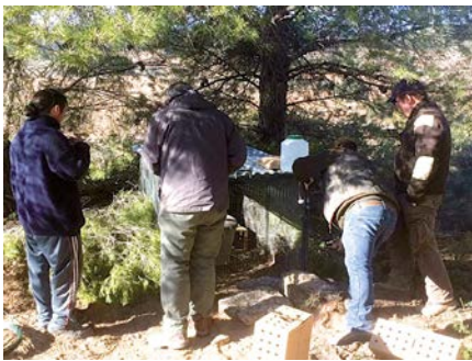
Instal·lació de les gàbies d'aclimatament, per directius de la Territorial i de la Societat La Perdiguera de Bot.

Amb la participació de quatre societats adscrites a la Territorial de les Terres de l'Ebre, una per comarca, els mesos de novembre i desembre de l'any passat es va posar en marxa de manera efectiva aquest encoratjador projecte de reintroducció de la perdiu roja en diverses APC (Àrees Privades de Caça) de les Terres de l'Ebre, una iniciativa que compta amb el suport de la mateixa Territorial, a més de les societats participants.