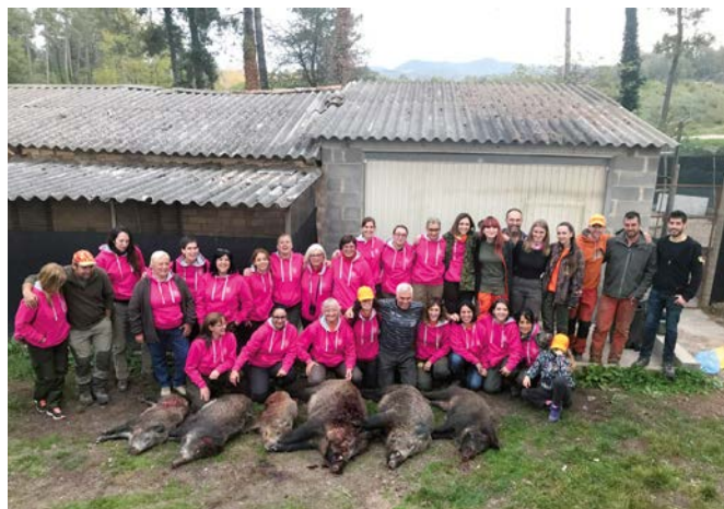
Participants a la segona jornada de joves caçadores.

El nostre més sincer agraïment a tots els patrocinadors i societats, així com als gossers, membres de les juntes directives, etc., per contribuir amb el seu esforç, col·laboració i entusiasme a fer possible aquestes trobades i al seu bon desenvolupament. ✪