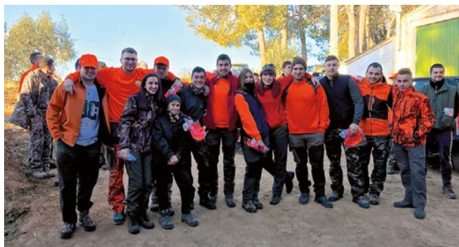
Els joves caçadors i caçadores participants valoren molt positivament aquestes iniciatives.

Des de fa temps, un dels objectius d'aquesta territorial és transmetre la nostra passió per la caça i incorporar els joves a l'activitat cinegètica. Amb aquest objectiu vam organitzar el passat mes de desembre la 1a Trobada de Caça Major adreçada, de manera específica, al jovent.