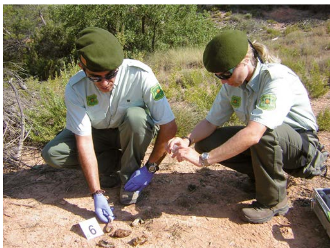
Agents en recollida esquers.

El cos d'Agents Rurals és, en primer lloc, la nostra policia mediambiental. I a més a més té una vessant molt important en la col·laboració en la gestió del nostre medi natural. Això vol dir que és un cos híbrid, no és un cos eminentment policial com pot ser el de Mossos