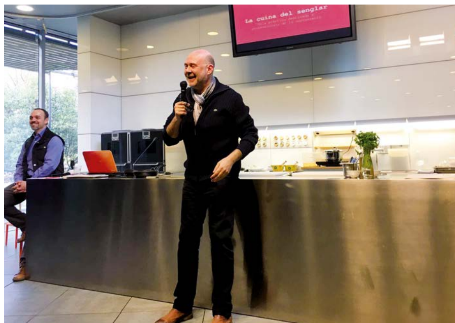
La presentació va tenir lloc el 21 de febrer a Món Sant Benet

El passat dimecres 21 de febrer l'auditori de la Fundació Alicia, situat al Món Sant Benet de Sant Fruitós del Bages, va acollir la presentació d'aquesta guia i receptari La Cuina del Senglar a Catalunya que revalor i recupera la cuina de la caça, una opció sostenible i d'equilibri ecològic, i proposa interessants propostes i reflexions per pal·liar els problemes derivats de la sobrepoblació d'algunes espècies cinegètiques com el senglar.